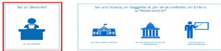
Figura 10- Selezione del profilo Docente

Dopo aver specificato e confermato il proprio indirizzo elettronico istituzionale, l'utente riceverà l'e-mail di Conferma registrazione al portale e potrà accedere alle funzioni di sua competenza (profilo: Docente) presenti sulla piattaforma della formazione.